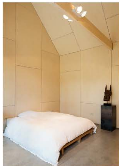
Het perfecte gastenverblijf.