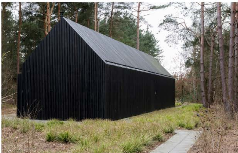
Een huis zoals een kind het zou tekenen. Zelfs de dakgoten werden netjes weggewerkt.

De buitenkant van het paviljoen verwijst naar de traditionele houten schuur bij de hoeve. Er werd gekozen voor houtskeletbouw omdat de opdrachtgevers wilden dat het bouwproces snel vooruit