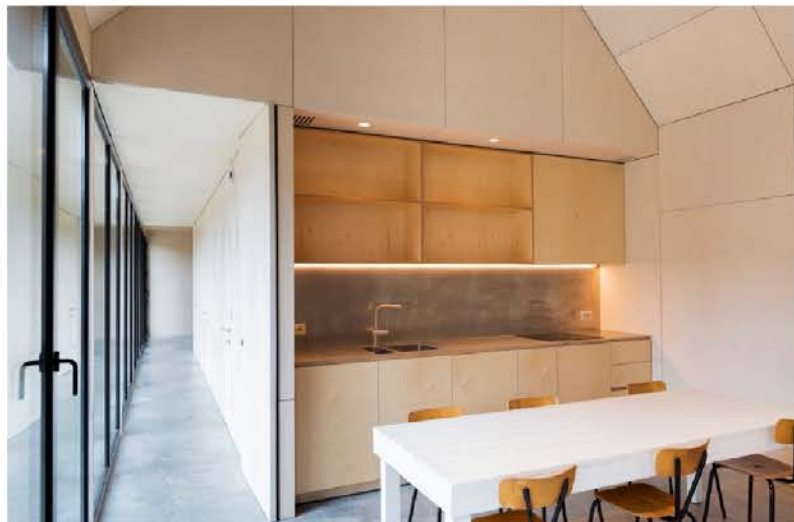
Eenvoud siert, ook in de keuken.