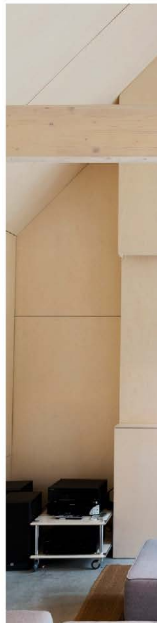
Ook de binnenkant werd volledig afgewerkt.

In het langgerekte volume zijn de leefruimtes aan de twee uiteindes geplaatst: een eet- en zithoek aan de oostzijde en een slaapkamer aan de westzijde van het volume. Tussen de twee leefruimtes is een blok geplaatst met de inkom en toilet, badkamer met sauna en keuken. Boven het blok in de nok bevindt zich een zolder, onder het blok een ruime kelder. Interieurarchitecte Lieve Werckx nam de afwerking en de indeling